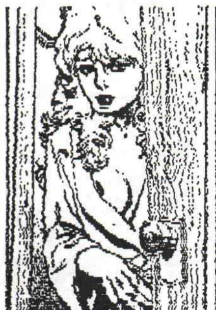
C'EST ENCORE UNE DIGIT DE NIKI...