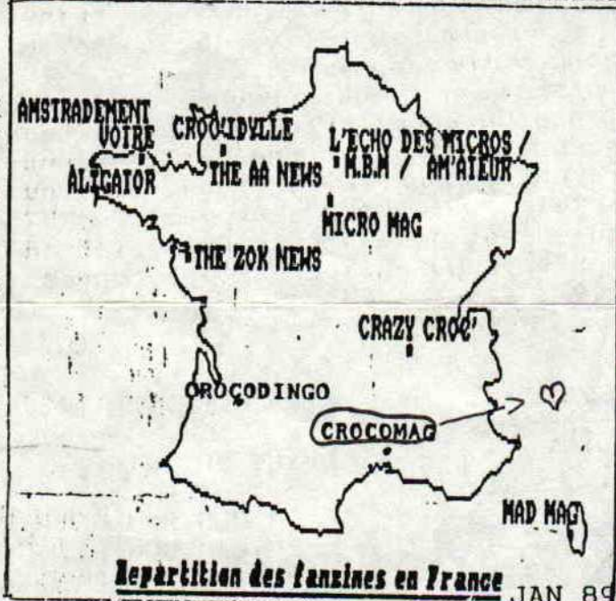
Repartition des fanzines en France JAN 89