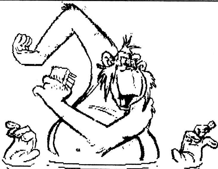
NULLOS CRACKER DANS SON BAIN

NE CHERCHEZ PAS D'ADRESSE, IL N'Y EN AS PAS.....NE CHERCHEZ PAS D'ADRESSE, IL N'Y EN AS PAS.....NE CHERCHEZ PAS