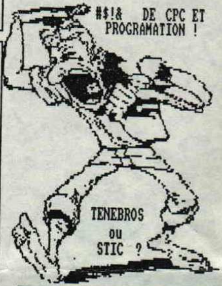
#$!& DE CPC ET PROGRAMATION !