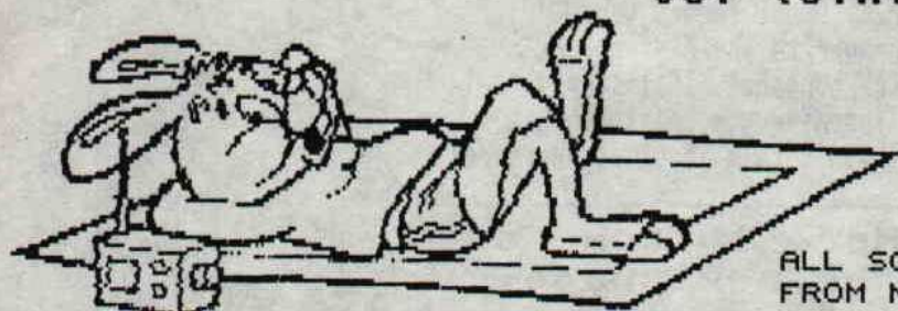
ALL SCANS FROM NIKI

ODIESOFT STEPH. JERRY NEOFYT (BIF/AFC) TWO MAG (EUREKA /GENESIS) WIZARD (MERLYN) ELMSOFT (GCS) BMC (GPA) THRILLER (GOS) BSC (GCS) WEEE! (GCS) EXCALIBUR (GOS) ASTERIX (UNIX) TMP (UNIX) WARLOCK (UNIX) DJH (GCS) FEFESSE