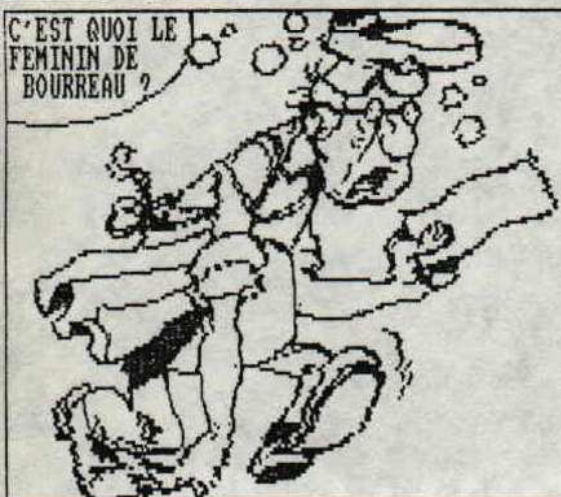
PHOTO DE NEOFYT APRES 2 JOURS D'ESCLAVAGE... (OXFORD PAO) SOUS LES DIRECTIVES DE NIKI !

Ben, vous voulez mon avis ? Des meetings comme ca, heureusement que ca n'est pas tous les ans, parceque je vous explique les problemes : lorsque vous voulez parler a un allemand, vous lui parlez en anglais (logique, non ?), et lui vous reponds en anglais, mais avec l'accent allemand. Ca vous donne un truc bizarre incomprehensible (vive l'Europe!). Sinon cette nuit j'ai bien dormi (environ 30 secondes), le cafe etait horrible (les allemands sont tombes raides morts en le goutant), Overflow est vraiment nul, NEWSKY a une grande... (et encore une allusion obscene censuree par vos bien-aimés redacteurs...) et les Logons ont vraiment des supers T-Shirts. Vive moi (NdNeofyt : et les chevilles ?) GOZEUR