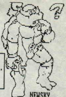
NEWSKY OF MICRODREAMS

OU EST-CE QUE J'AI MIS MON DIGITALISEUR ?????????????