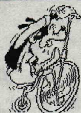
TWO MAG A BEAU COURIR...

Style du meeting: c'est cool à chier ici!!! Nourriture: J'ai seulement essayé les baguettes (bien) et les tomates (pareil!).