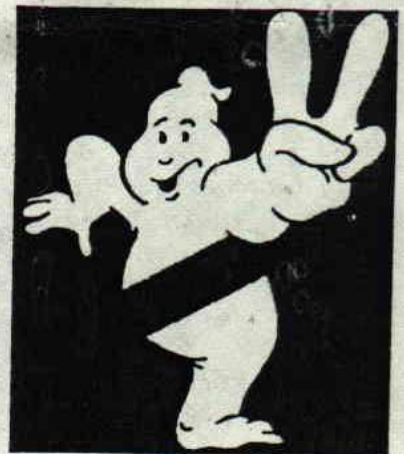
by John Difool and Pierrot le fou.