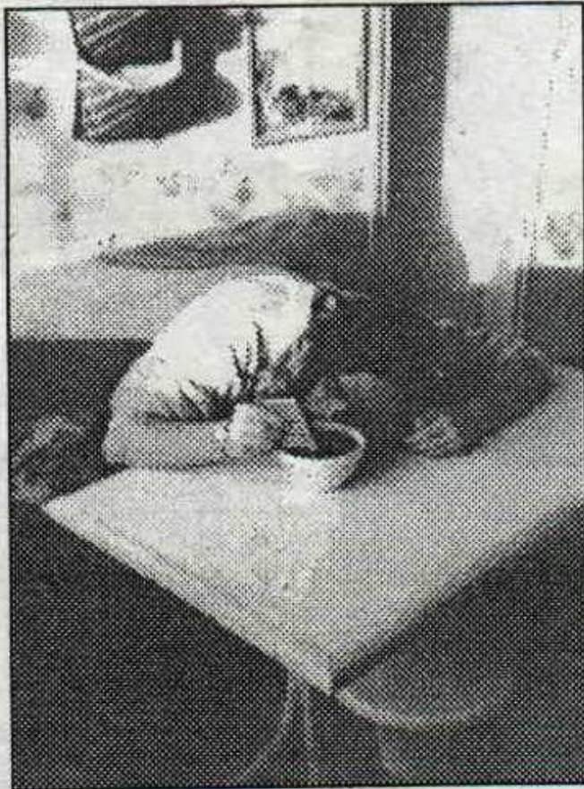
3 - Le petit- déjeuner : vrai- ment très dur...