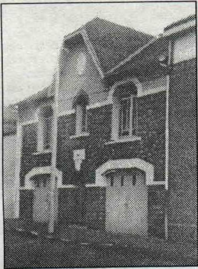
1 - Tout a commencé ici...