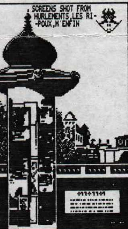
SCREENS SHOT FROM HURLEMENTS, LES RI- -POUX, M'ENFIN