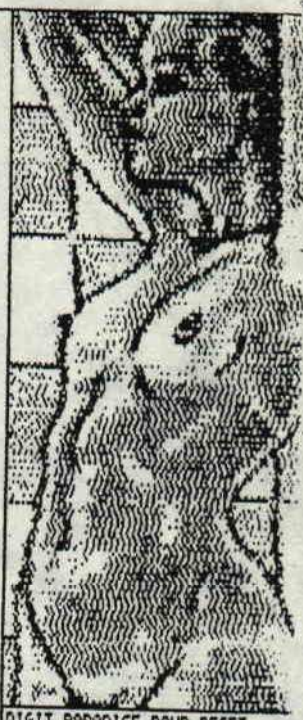
DIGIT PARADISE POUR RESET.

C'est juste pour montrer que le BASIC n'est pas mort!! Je sais, c'est un peu long mais le résultat en vaut la peine, croyez-moi braves gens.