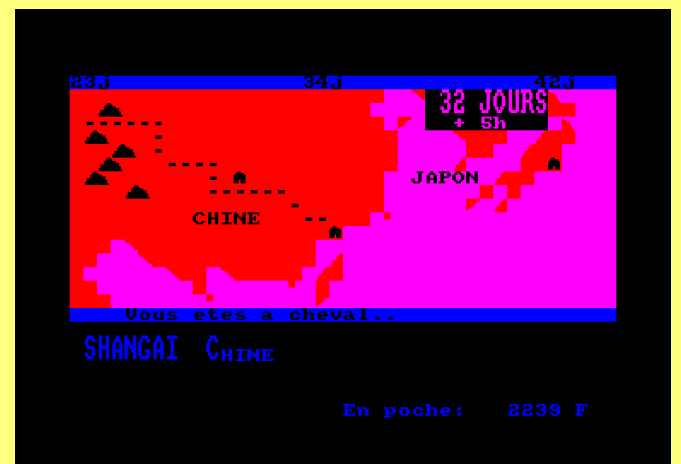
A travers la Chine jusqu'à Shanghai